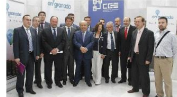
Todos los integrantes de «On Granada Tech City»

La Confederación Granadina de Empresarios lidera el proyecto para promover la importante industria TIC granadina