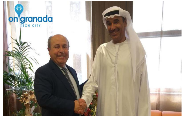
Visita del Presidente de Honor a Dubái

Apoyo institucional en el país del Embajador, con visitas por parte de las instituciones granadina .