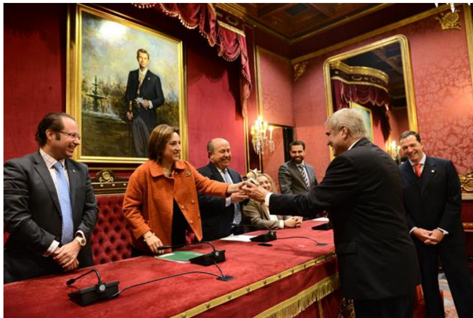
Nombramiento de los embajadores para Alemania

Dispone de todos los recursos de nuestra OTIP (Oficina Técnica de Información Permanente), así como su identificación en calidad de Embajador, materializada en tarjetas de visita y publicación de su cargo en los medios, soportes y nuestro web site. Apoyo institucional en el país, con visitas por parte de nuestras instituciones.